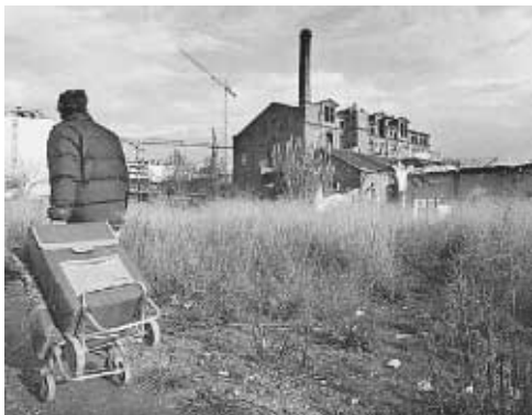
La antigua fábrica estaba ocupada por un grupo de indigentes

La ciudad de la imagen está delimitada por la Diagonal y las calles Llacuna, Almogàvers y Ciutat de Granada y contiene como elemento singular la fábrica que será reformada. El proyecto —forma parte del distrito tecnológico 22@— llegará el próximo viernes al pleno municipal y prevé que los edificios con fachada a la avenida Diagonal tengan una altura de planta baja más siete pisos, mientras que los que se encuentren en segunda línea tengan planta baja más 17 pisos. En total,